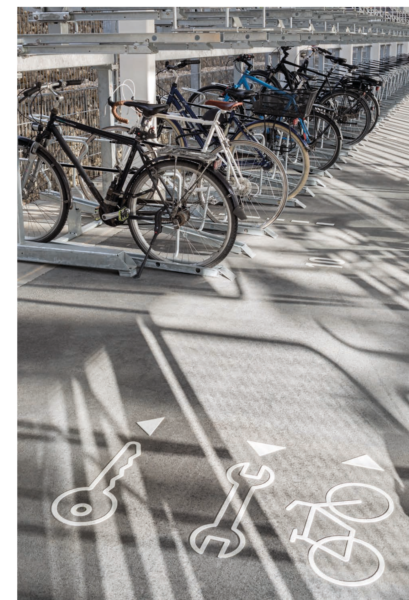
Leitsystem mit Piktogrammen