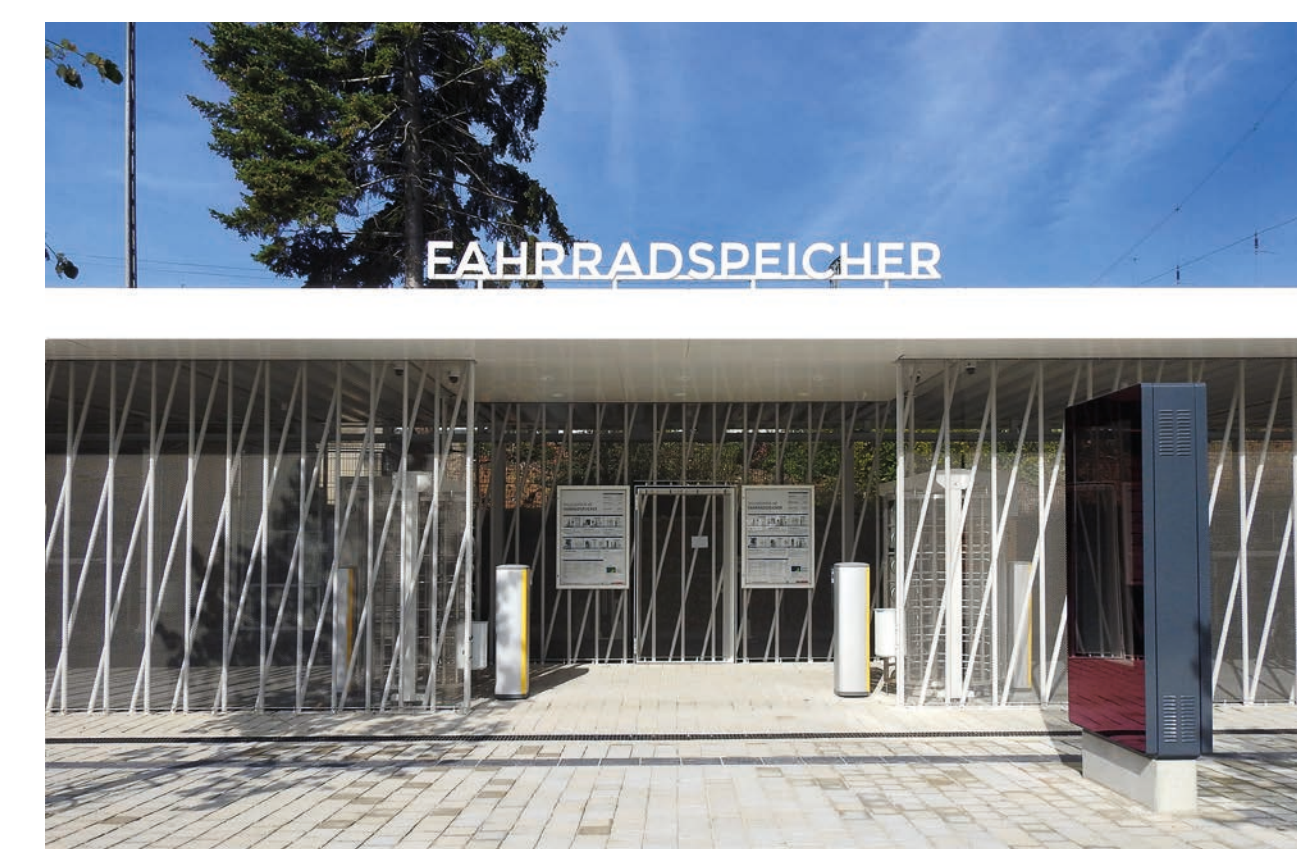
Eingangssituation Mitteleingang