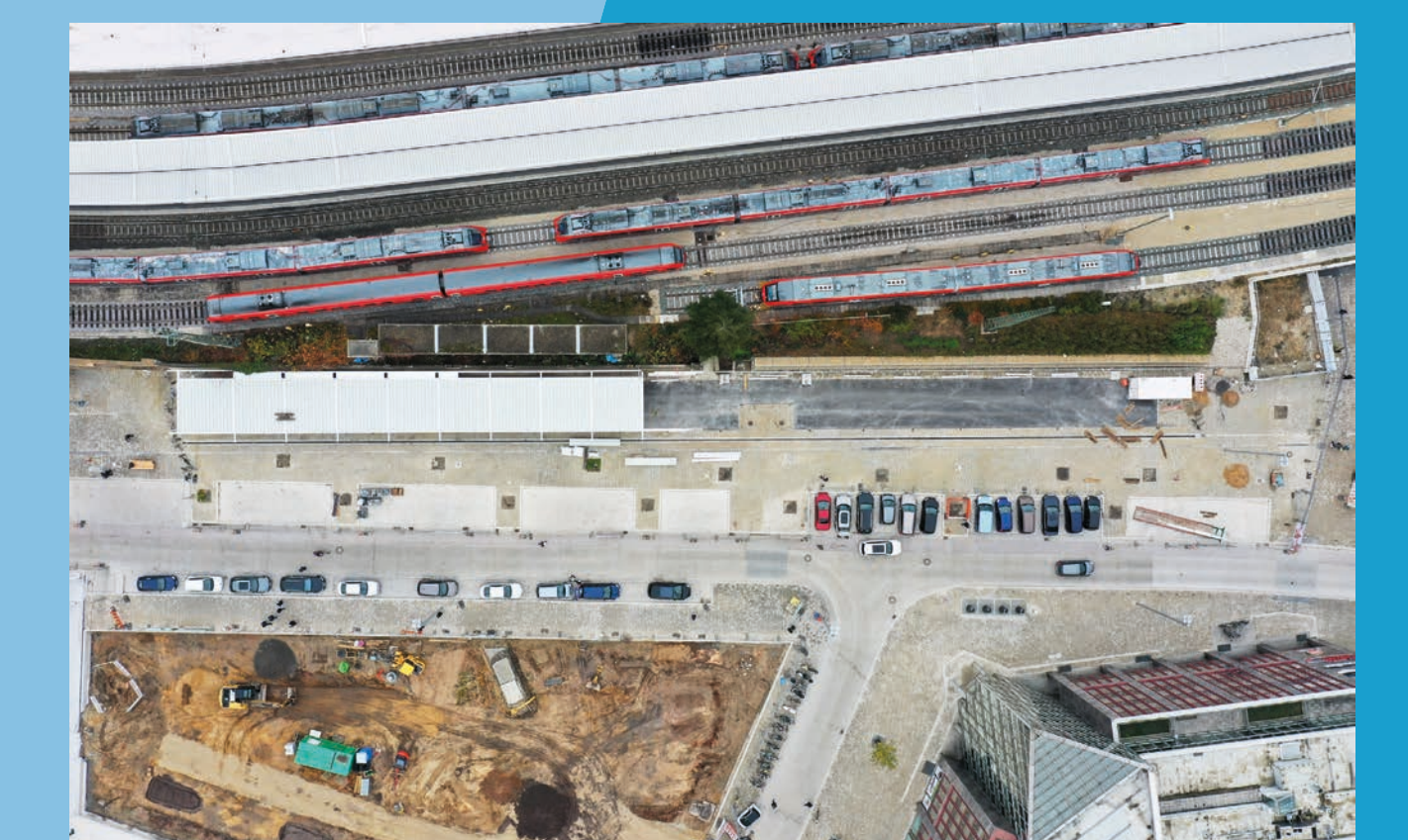
Drohnenfoto Bauzustand