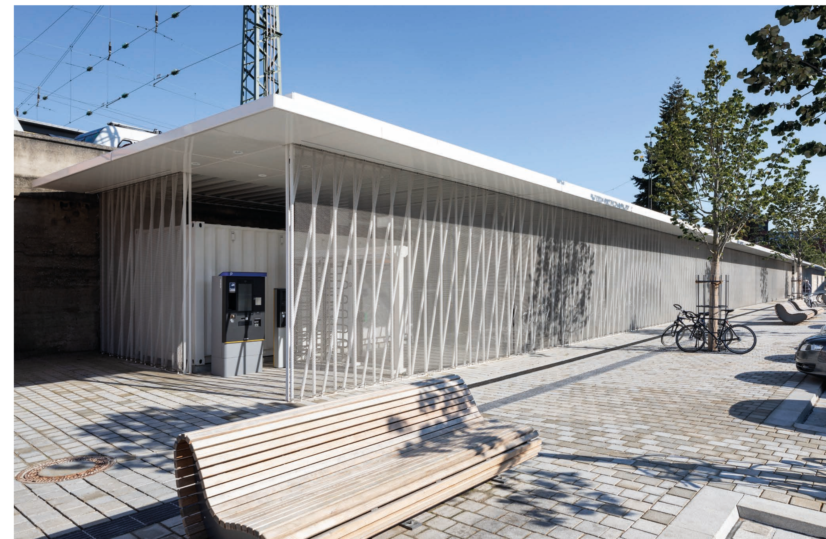
Außenansicht und neue Platzgestaltung

Die Gründung der Stahlkonstruktion erfolgt auf Streifenfundamenten, die aufgrund der geringen Tragfähigkeit des anstehenden Baugrundes über Magerbetonplomben bis in die gewachsenen quartären Sande tiefergeführt werden. Sämtliche Streifenfundamente in den Regelbereichen wurden aufgrund der hohen Anzahl an gleichartigen Fundamenttypen aus Gründen der Wirtschaftlichkeit als Vollfertigteilelemente ausgeführt. Gleichzeitig konnte so eine hohe Ausführungsqualität und Genauigkeit der Fundamenthöcker mit Einbauteilen unter den eingespannten Stützen erreicht werden.