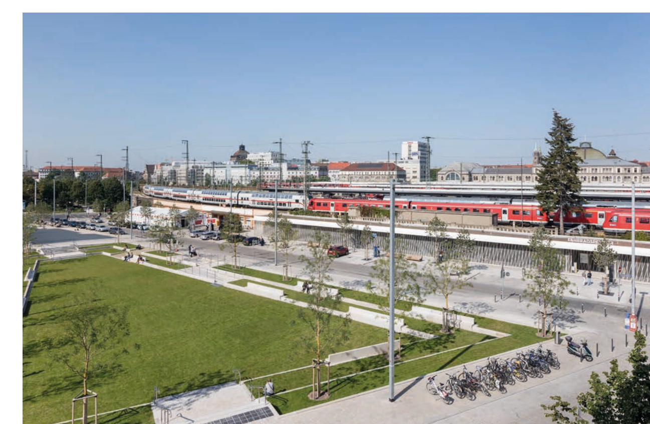
Situation Hauptbahnhof und neu gestalteter Nelson-Mandela-Platz