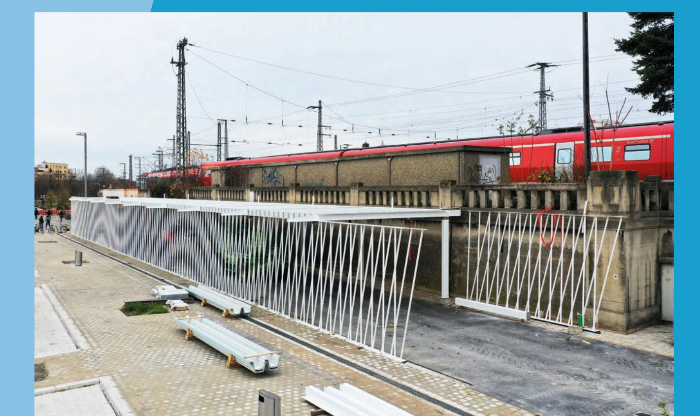
Außenansicht Bauzustand