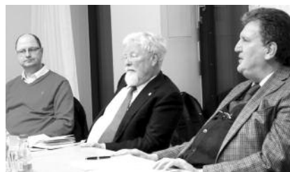
Einige Teilnehmer des Werkstattgesprächs.

Die Freie-Wähler-Landtagsfraktion setzt sich dafür ein, dass bayerische Hochschulen künftig wieder die Möglichkeit haben sollen, Studiengänge