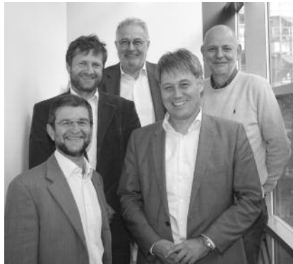
Mitglieder des Arbeitskreises.

Auf der anderen Seite finden wir Länder, die eine mit unserer heimi-