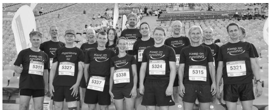
Lauffreudige Kammermitglieder beim B2Run 2015.

Die Biathlon-Olympiasiegerin und Weltmeisterin Magdalena Neuner ist Botschafterin des diesjährigen B2Run. Vielleicht laufen ja Sie an diesem Abend Schulter an Schulter mit der ehemaligen Sportlerin des Jahres?