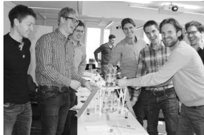
Teilnehmer des ersten Jahrgangs des Traineeprogramms bei Projektarbeiten.

Ein hoher Anteil an Gruppen- und Projektarbeiten bindet die Trainees aktiv ein. Anhand von Fallbeispielen aus