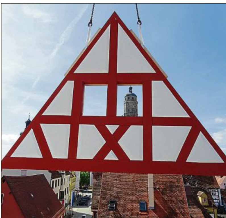
Die Giebelelemente mussten mit dem Kran auf die Gebäudevorderseite gehoben werden.

In Zusammenarbeit mit der Bayerischen Ingenieurkammer-Bau stellt die Bayerische Staatszeitung auf einer Sonderseite in regelmäßigen Abständen spannende Projekte von Mitgliedern der Ingenieurkammer-Bau vor.