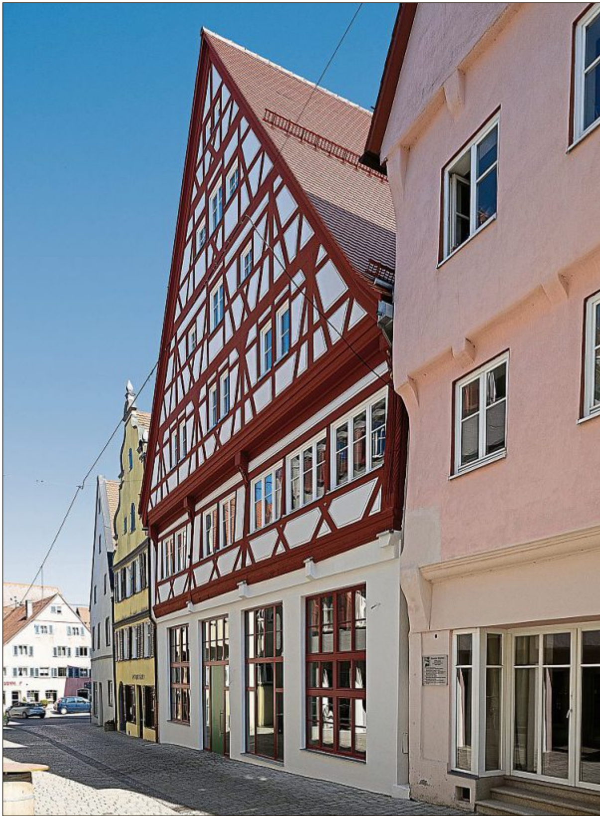
Westansicht mit neuem vorgefertigtem Fachwerkgiebel.

Final genehmigt und umgesetzt wurde die Denkmalsanierung wie folgt: Auf der Gebäuderückseite (Ostansicht) wurde der neuzeitliche Anbau an den historischen Bestand angeglichen, indem das Dach um 90 Grad gedreht und auf die gleiche Höhe des Hauptdachs angehoben wurde. Auf der Vorderseite des Gebäudes (Westansicht) wurde der Fachwerkgiebel im Obergeschoss saniert und beschädigte Teile wurden in Absprache mit dem Denkmalamt ergänzt oder ausgetauscht.